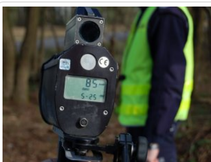
działania kontrolno - prewencyjne na DK nr 50