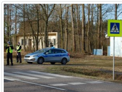
działania kontrolno - prewencyjne na DK nr 50