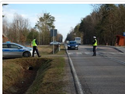
działania kontrolno - prewencyjne na DK nr 50