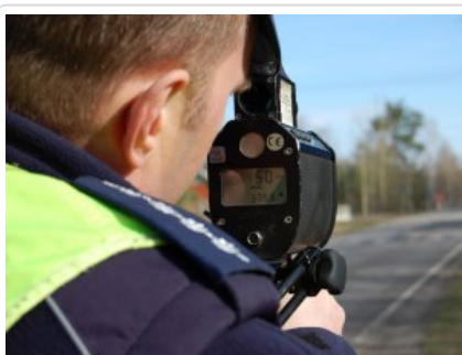
działania kontrolno - prewencyjne na DK nr 50