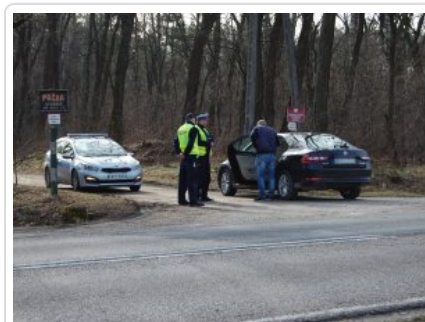
działania kontrolno - prewencyjne na DK nr 50