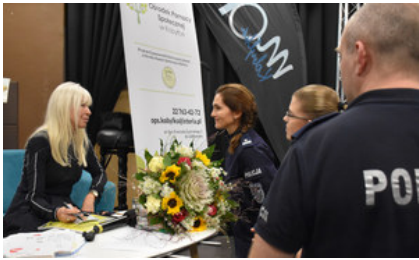
Spotkanie Dzielnicowych z KP w Tuszcu z seniorami